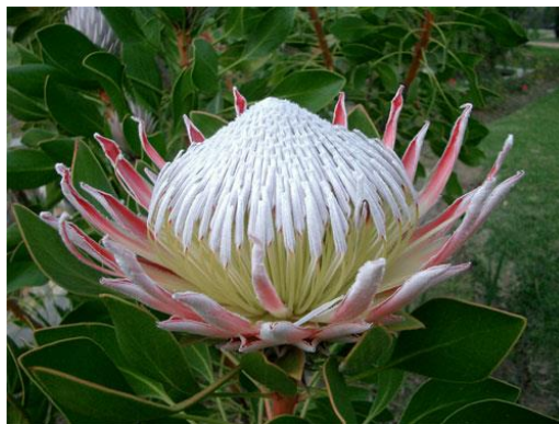
Protea : la fleur symbole de l'Afrique du Sud

La soirée a commencé par la présentation d'un beau diaporama sur l'Afrique du Sud et ses vignobles. Cette projection s'est faite dans le chai sur le grand écran dans la fraîcheur et au milieu des cartons de Champagne prêts à être livrés. Il ne manquait plus que le Père Noël sortant d'un foudre avec sa hotte remplie du précieux nectar. Les photos magnifiques nous ont fait découvrir ce pays diversifié tant du point de vue ethnique que géologique. Le grand message était aussi l'alliance entre l'amélioration du vignoble et le respect de la biodiversité. Chaque région viticole a identifié sa réserve biologique et son écosystème : dès lors la viticulture est un des outils de préservation de ce fragile équilibre. Les diapositives nous ont montré ainsi des paysages, des arbres et des fleurs extraordinaires, tous associés à un programme de préservation (UNESCO ou autres).